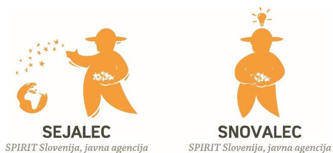
Slika 1: Logotipa nagrad agencije SPIRIT – Sejalec in Snovalec ( http://www.podjetniski-portal.si/index.php?t=news&id=2701 )