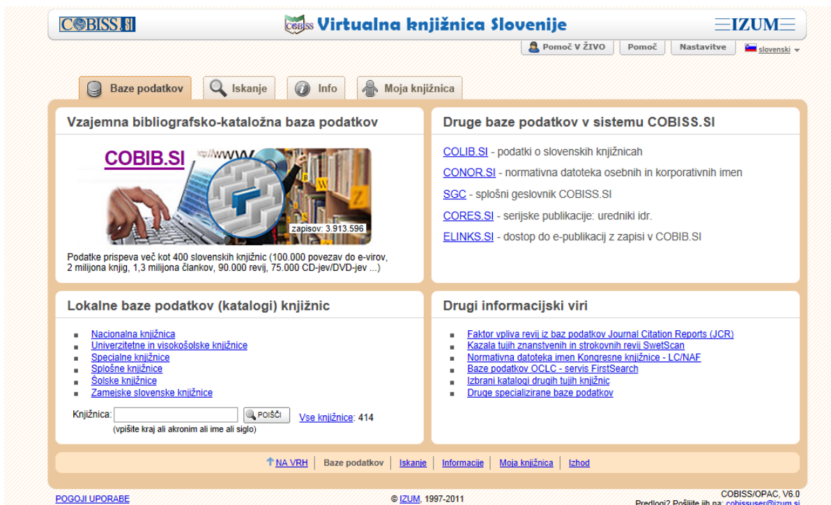
Slika 3: Vstopna maska v sistemu COBISS.SI ( http://www.cobiss.si/scripts/cobiss?ukaz=getid&lani=si )

V sistem COBISS.SI je vključena ponudba specializiranih baz podatkov slovenskih proizvajalcev, na podlagi konzorcijskih pogodb s tujimi informacijskimi servisi pa zagotavlja IZUM uporabnikom iz Slovenije brezplačen dostop do različnih tujih baz podatkov in servisov (Web of Science, OCLC, FirstSearch, ProQuest ...). Za dostop do baz podatkov OCLC (FirstSearch), ki vsebuje polna besedila člankov, je potrebno posebno dovoljenje knjižnice, pri kateri smo registrirani kot člani, knjižnica pa mora imeti urejene formalnosti z OCLC-jem in IZUM-om.